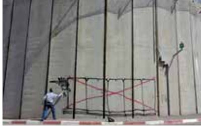
Fin de rire