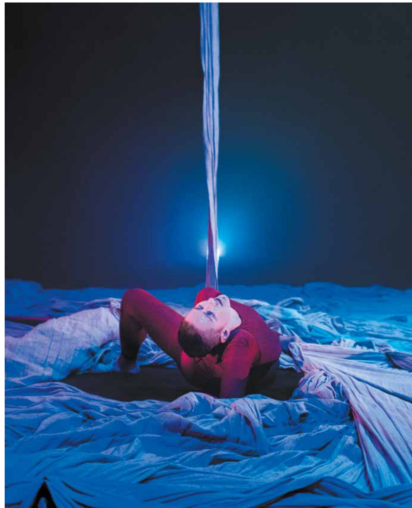
On Earth I'm Done : Mountains © Urban Jören

Conception des éclairages : Jonatan Winbo