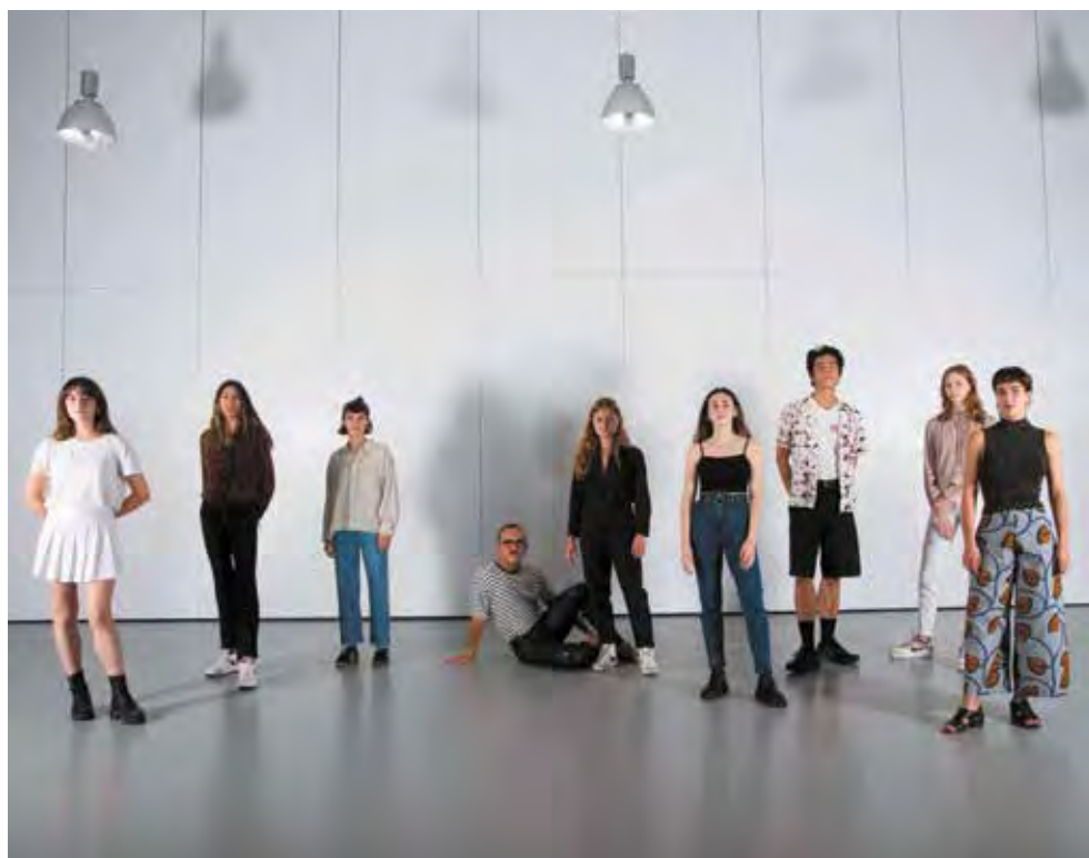
L'Ensemble Chorégraphique CNSMD de Paris