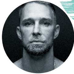
P.14 Pontus Lidberg Les Sept Péchés capitaux – 1 ère en France Roaring Twenties – Création Sa. 18 – Di. 19 juin