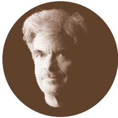
P.12 Philippe Decoufflé Stéréo – Création Ve. 17 – Sa. 18 – Di. 19 – Lu. 20 juin