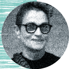
P.34 Robyn Orlin We wear our wheels with pride... – Création Sa. 25 – Di. 26 juin