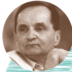
P.36 Raimund Hoghe An Evening with Raimund Di. 26 – Lu. 27 juin