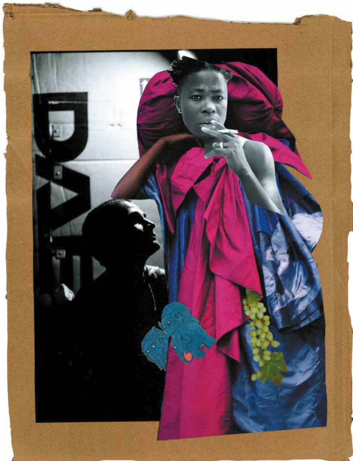
© Collage de Robyn Orlin avec les photos de John Hogg (Robyn Orlin) et d'Antoine Tempé (Nadia Beugré)