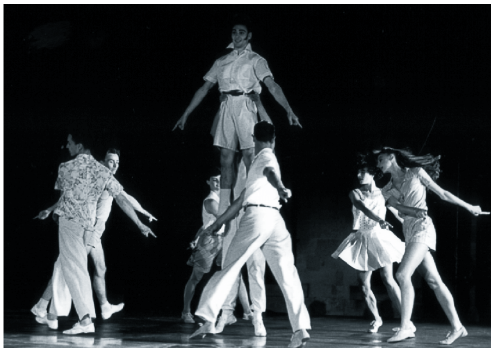
Necesito, pièce pour Grenade (1991) par la compagnie Bagouet