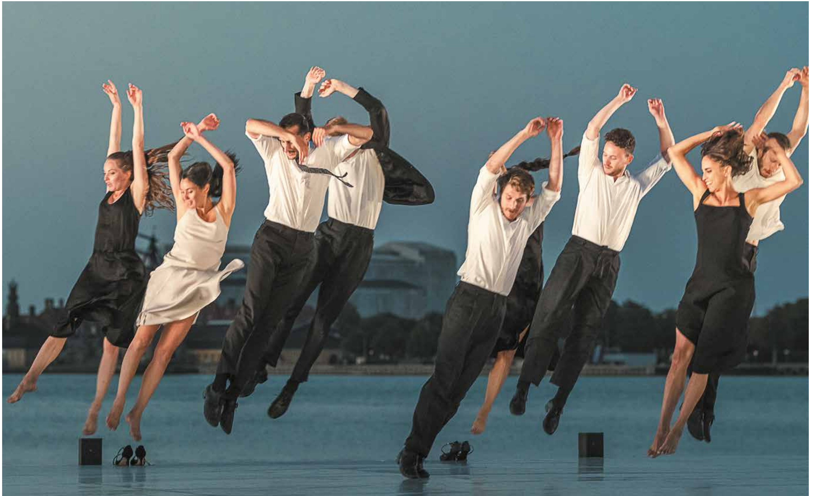
Danish Dance Theatre