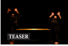
TEASER ALGERIA ALEGRIA de Wampach