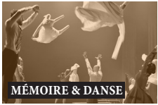
TABLE RONDE #1

Revivez la table ronde Le désir de reprise, une impulsion créative